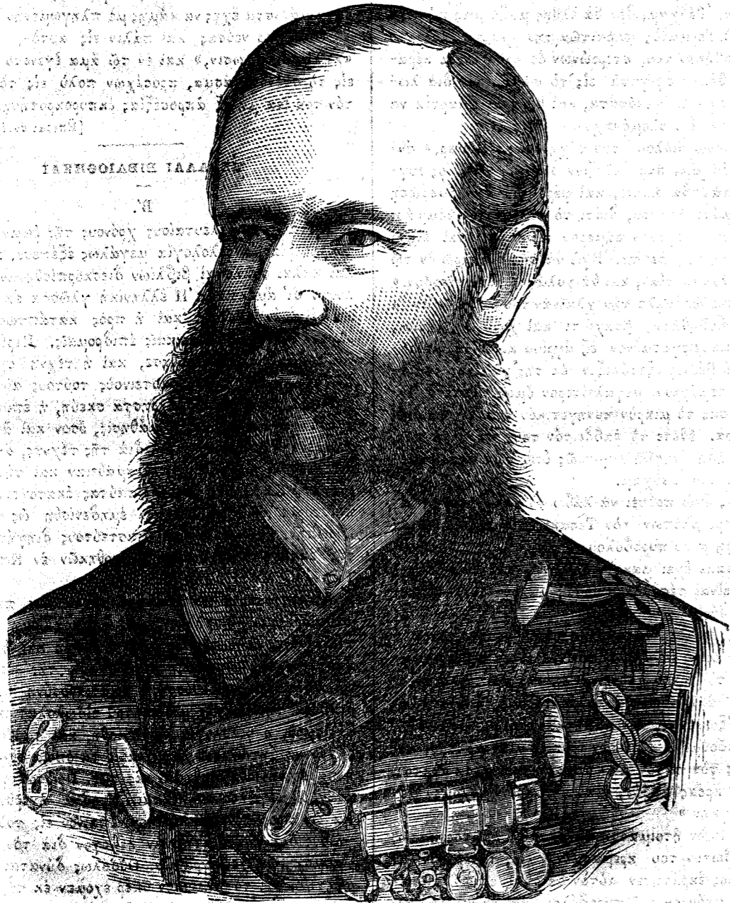
Ὁ Στρατηγὸς ROBERTE

λαϊῶν βιβλίων εὐρηται ἐντάυθα (ἐν Ἀγγλίᾳ). Ἡ πρὸς τὰ βιβλία διάθεσις ὁμοῦ κατέστη γενικὴ, καὶ εὐπαιδευτοὶ ἄνδρες συνήγαγον τὰς συλλογὰς αἰτίνες ἐφήμισαν τὴν Ρώμην, τὴν Φλωρεντίαν, τὴν Νεάπολιν, τὴν Ἑνετίαν, τὴν Βιέννην καὶ τοὺς Παρισίους. Πολὺ πρὸ τούτου — κατὰ τὴν ἀρχὴν τῆς 15 ἑκατονταετη-